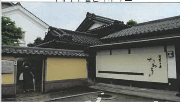
나가미치 사무라이 거리