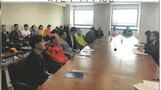
이시카와현 관광총괄부장 면담