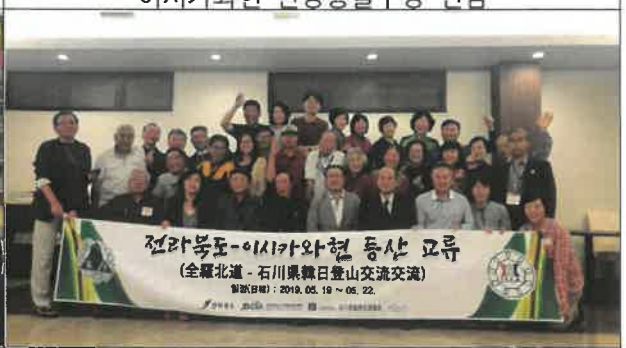
2019 전라북도-이시카와현 등산교류 영송회