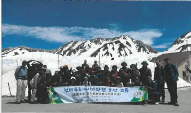
다테야마 알펜시아 루트