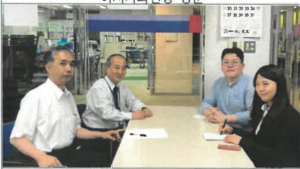
이시카와현 국제교류협회 업무협의