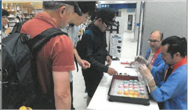
전통과자(화과자) 만들기 체험